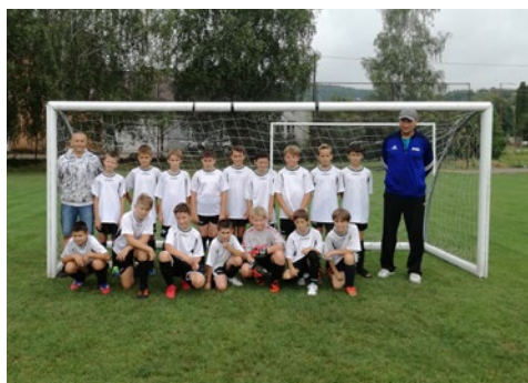
Mladší žiaci U13 súťažný ročník 2018/2019 IV. liga OBFA Trenčín