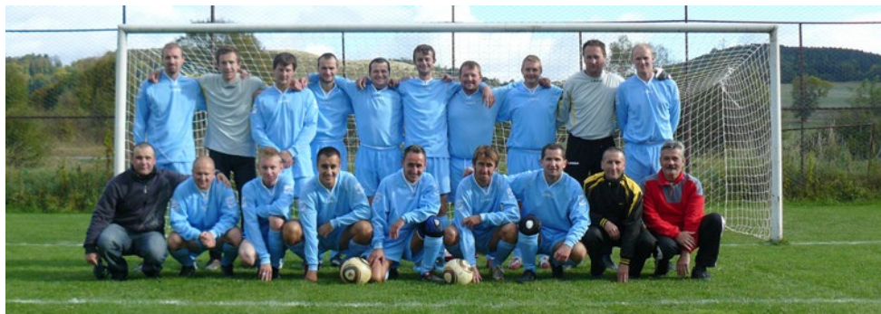
VIII. liga – juh ObFZ TN - rok 2011/2012