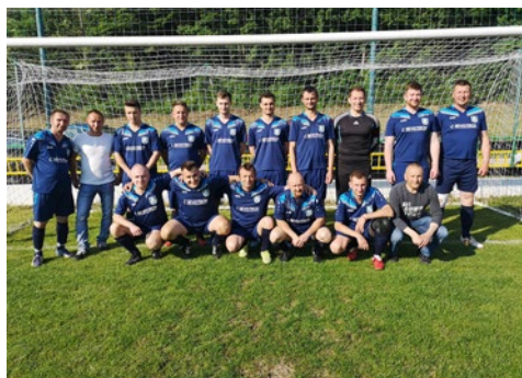
VII. liga Double Star Bet - JUH - ObFZ TN Rok 2018/2019