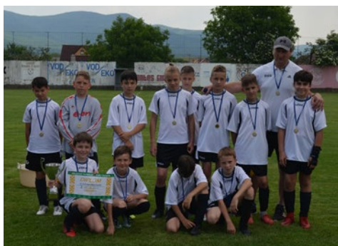
Po finále omajstra oblasti v kategórii mladších žiakov U13