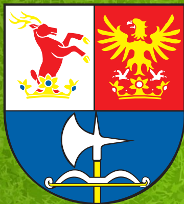
TRENČIANSKY SAMOSPRÁVNÝ K ♦ R ♦ A ♦ J

Obec Prieasné ďakuje všetkým, ktorí sa spolupodielali na príprave tejto publikácie.