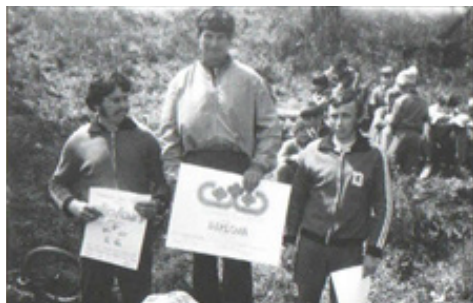
Ľahká atletika - beh - víťazi v kategórii „MUŽI“

Prvý ročník sa konal 9. mája 1984 za účasti 94 pretekárov vo všetkých kategóriách. Najviac bolo domácich bežcov a bežkýň. Ďalej sa zúčastnili pretekári zo Senice, Brezovej, Polianky, Myjavy, Kútov, Štefanova, Trnavy, Košarísk, Malaciek a Skalice. Trate boli vytýčené z ihriska do Kotla i od Ševcov (Frašťáku) v dĺžkach 500 m, 850 m, 1350 m, 1825 m, 3450 m a 5075 m. Najmladší pretekár mal 7 rokov a najstarší 71 rokov.