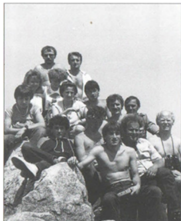
Turisti - výstup na Rysy