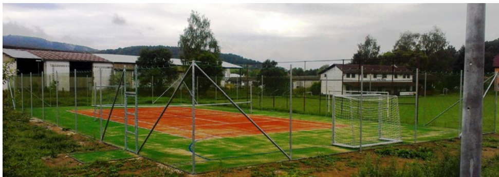
Viacúčelové športové ihrisko, 2012