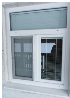
Priestory a okná pred modernizáciou apo nej