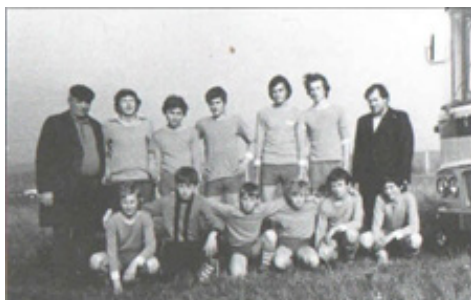
Žiaci v 70 rokoch